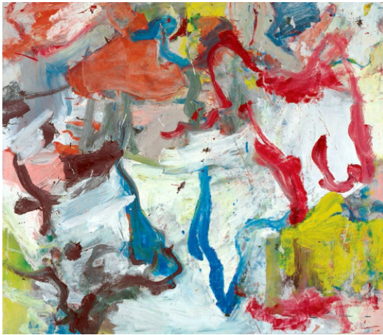
Рис. 2. Виллем де Кунинг. «Без названия IV». 1977. Музей коллекции Менил (Хьюстон, США)

Как философские объекты картины де Кунинга представляют иную онтологию, нежели картины Мондриана. Если картины Мондриана предполагают дуалистическое движение отстранения человека от мира, то полотна де Кунинга говорят об основополагающей вовлеченности в него. И если у Мондриана эта отстраненность связана с асимметричным человеческим господством над пассивной материальностью, то у де Кунинга внимание акцентируется на куда более симметричном взаимодействии человеческого и нечеловеческого. Живопись де Кунинга — неразделимо совместный продукт человеческого и нечеловеческого : де Кунинг, краски и холст. Это децентрированное производство, в котором де Кунинг был одновременно и автором, и исследователем, и активным, и пассивным. Вот первое основание для противопоставления двух художников и их работ. Второе касается временности . Картины Мондриана не затрагивают тему времени. Можно представить себе живопись Мондриана как материализацию почти безвременного платонического образа — образа, который можно ясно представить в уме и в любой момент запустить в реальность. Напротив, представить себе произведения де Кунинга можно лишь появляющимися в реальном времени телесной практики: это должно было произойти — нанесение такого количества этой краски на некоторую уже заполненную поверхность, затем должно было произойти то и т.д. И все это вычерчивает уникальную траекторию, которая приводит к этому изображению. Конечная точка этой траектории ни в коем случае не была пред-