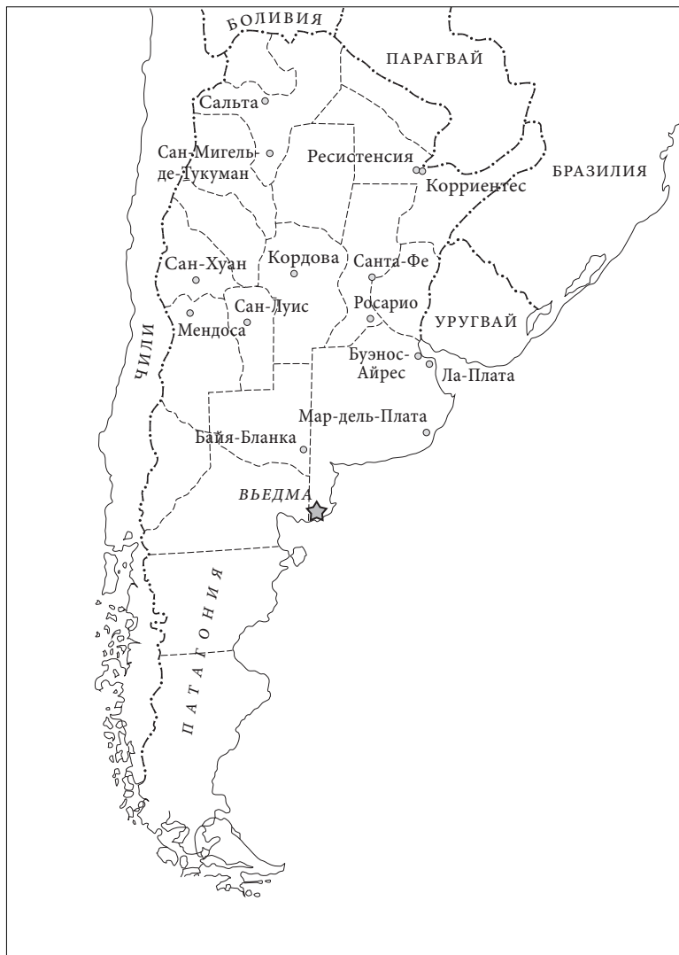
РИС. 1. Аргентина: расположение новой столицы

наиболее важных госслужащих из Буэнос-Айреса и превратить их в бюрократическую элиту, которая бы управляла страной из Вьедмы. Залогом ее эффективности будет именно перемещение госслужащих из их нынешней среды.